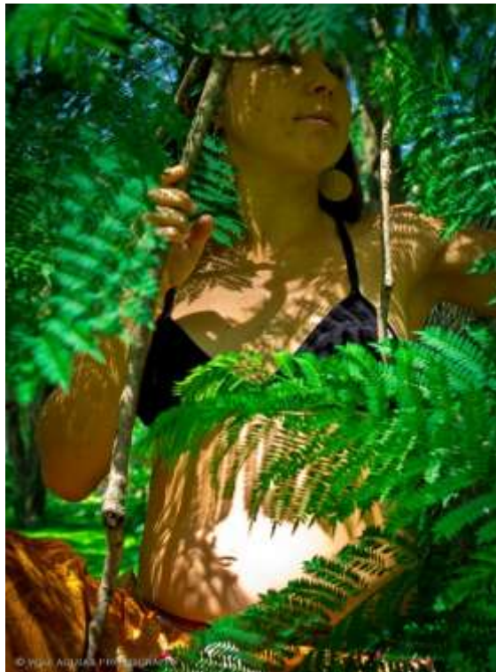
Fig. 09. Paula Tura. Corpo folha II , 2012. Ruínas da Lagoinha, Ubatuba-SP. Acervo da artista