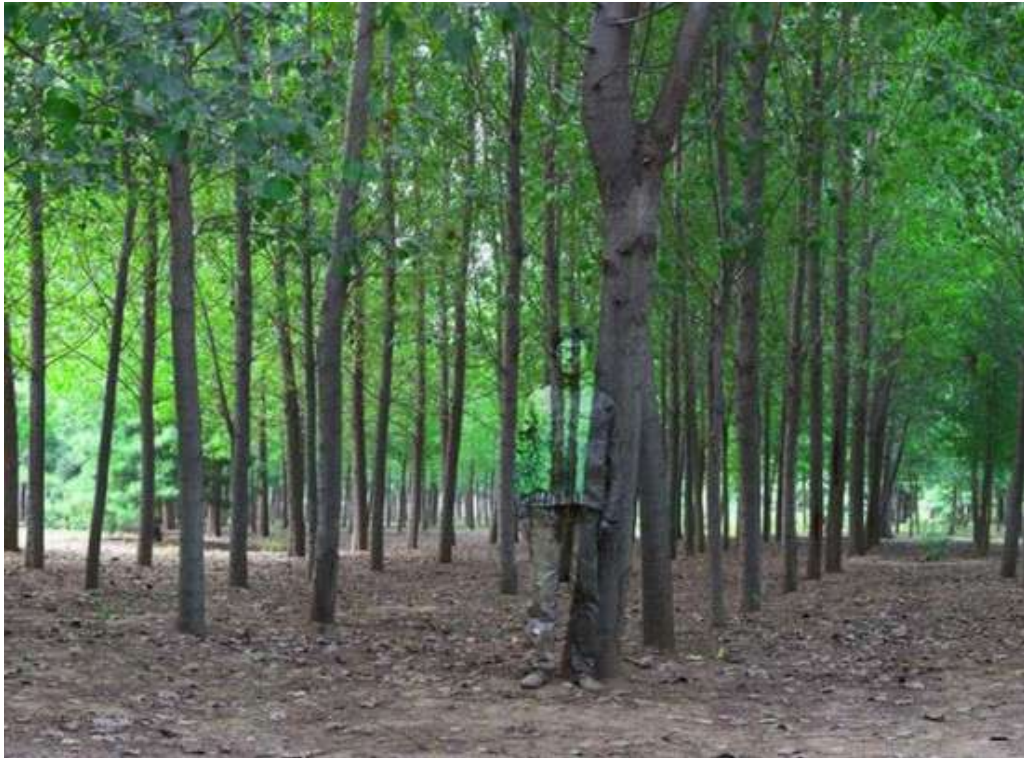
Fig. 02. Liu Bolin. Hiding in the city no 94: in the woods , 2010. Fotografia 63cm x 80cm.

Não estaria Liu Bolin 3 (fig. 02) com esta sua foto parafraseando o trecho acima de Thérèse Bertherat 4 ?