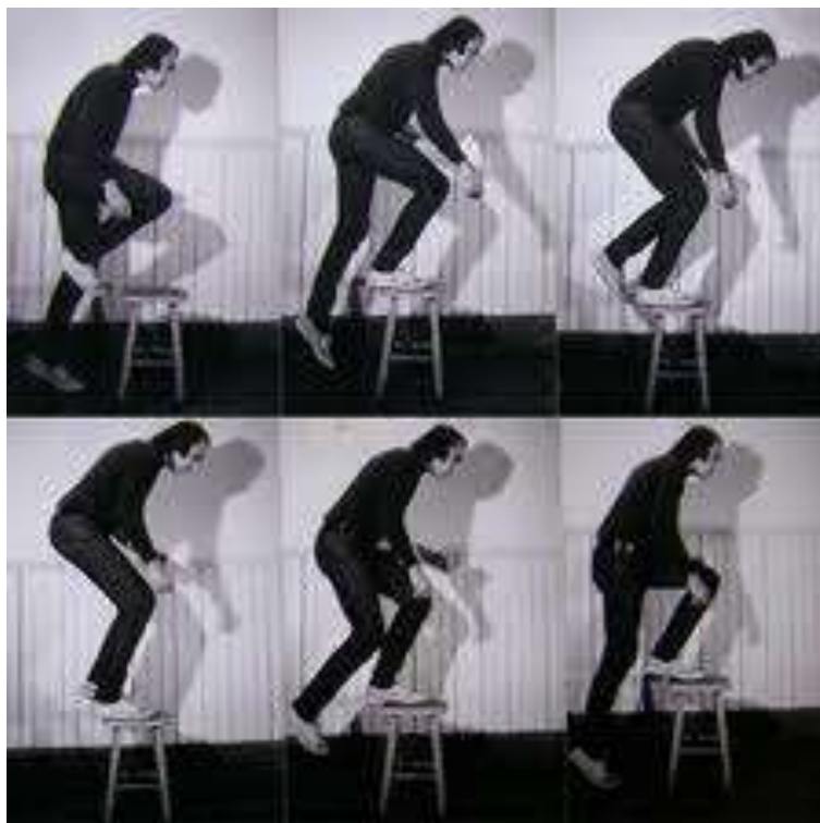
Fig. 03. Vito Acconci. Step piece , 1970. Performance

Voltando-se para a questão do movimento e da sombra, a autora apresenta uma performance do norteamericano Vito Acconci (fig. 03) onde há também a projeção da sombra de seus movimentos na parede. Com a ideia de enaltecer a questão da desconstrução do corpo inclui-se aqui as fotos desta performance :