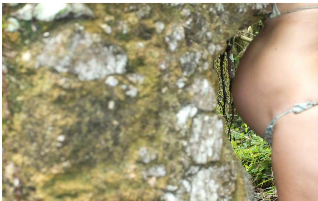
Fig. 04. Paula Tura. Encaixe I , 2013. Ruínas da Lagoinha, Ubatuba-SP. Acervo da artista